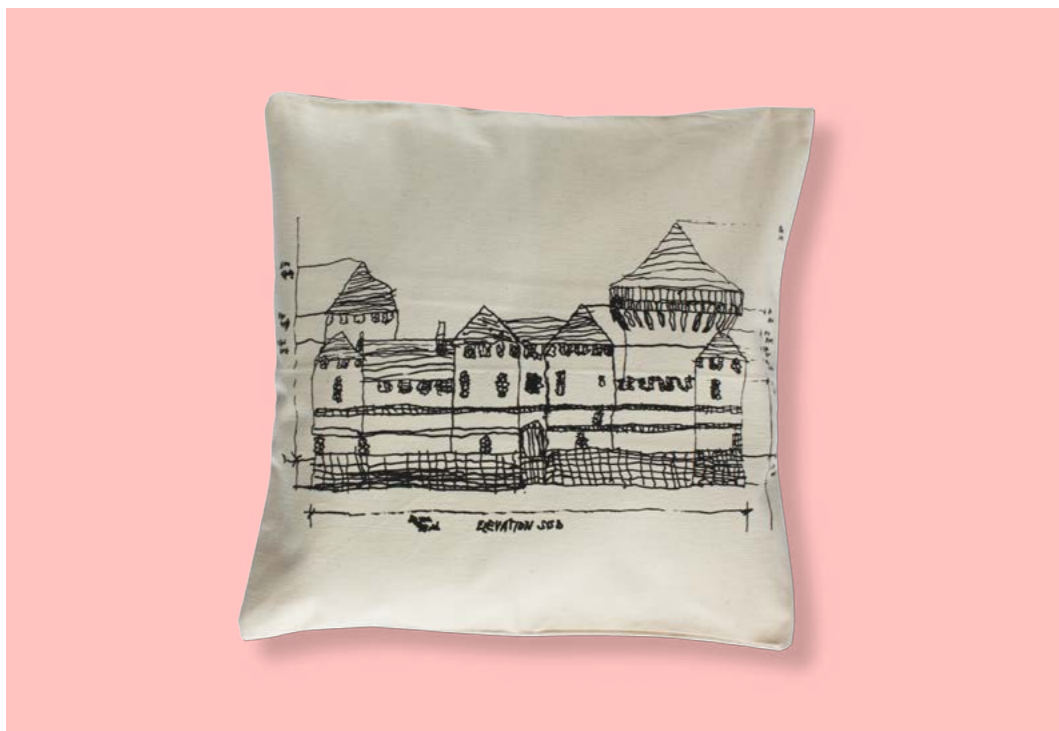
Coussin coton dimensions 1,40cm/1,40cm réf: COU