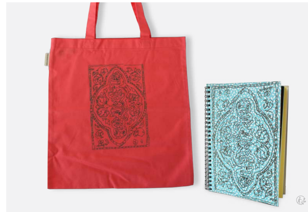
Sac et carnet accordés