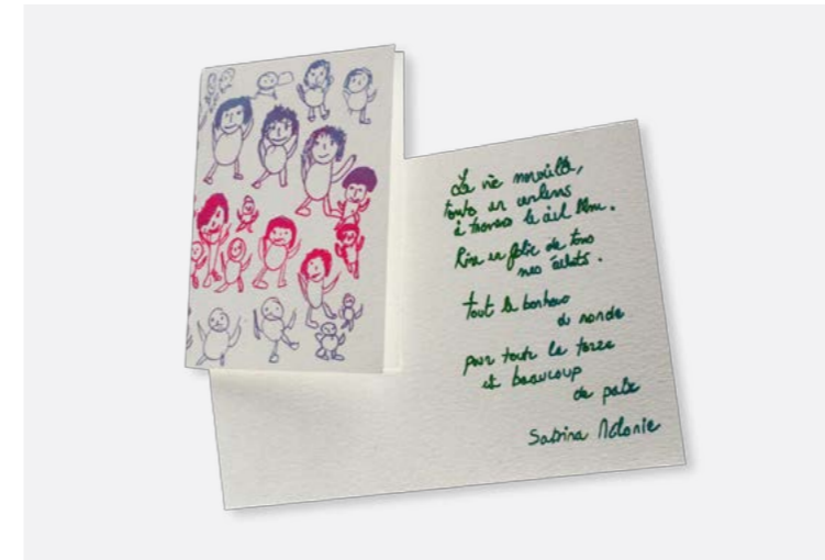
Cartes de vœux papier réf: CVO