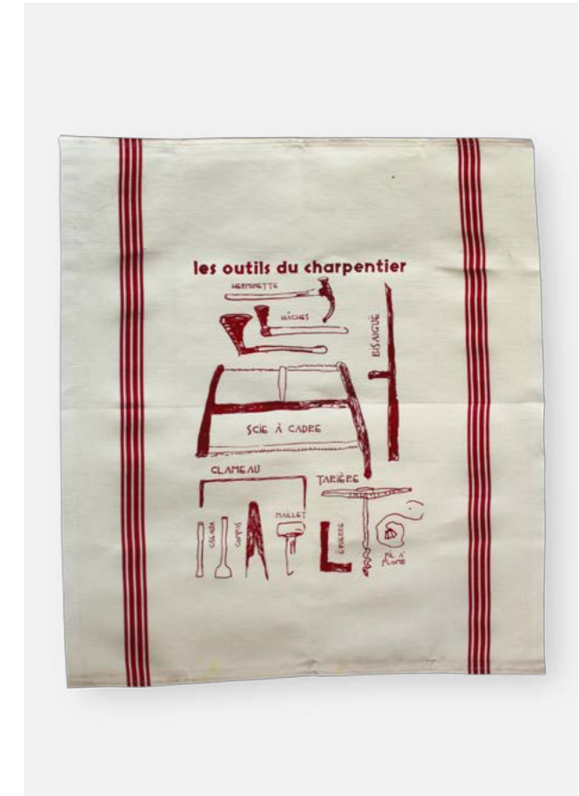
Torchon Coton dimensions 1,58cm/1,06cm réf: TOR