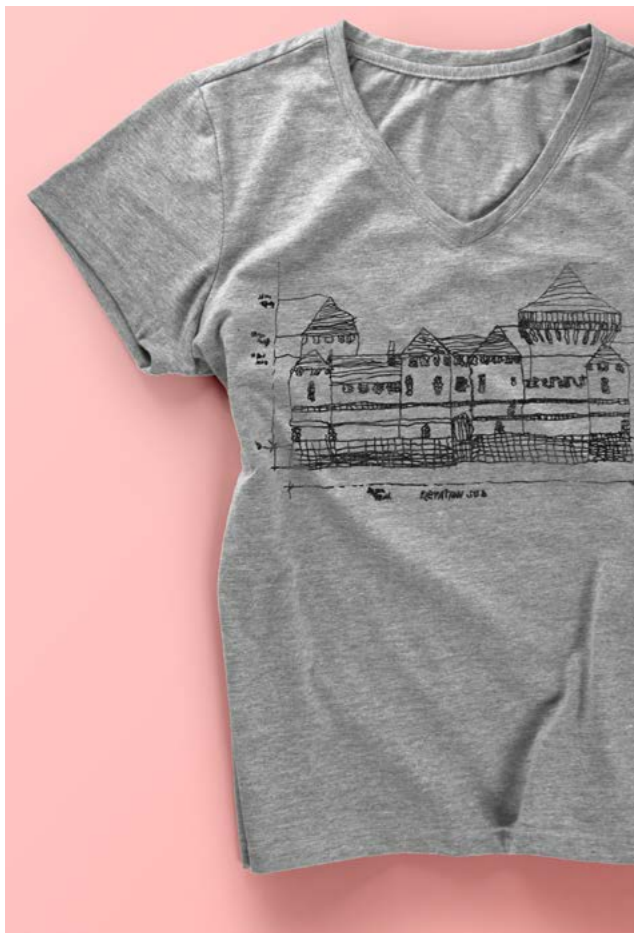
Tee-shirt tee-shirt coton réf: TEE

Les produits peuvent être réalisés sur mesure avec une proposition graphique personnalisée, adaptée à votre identité d'entreprise ou de structure.